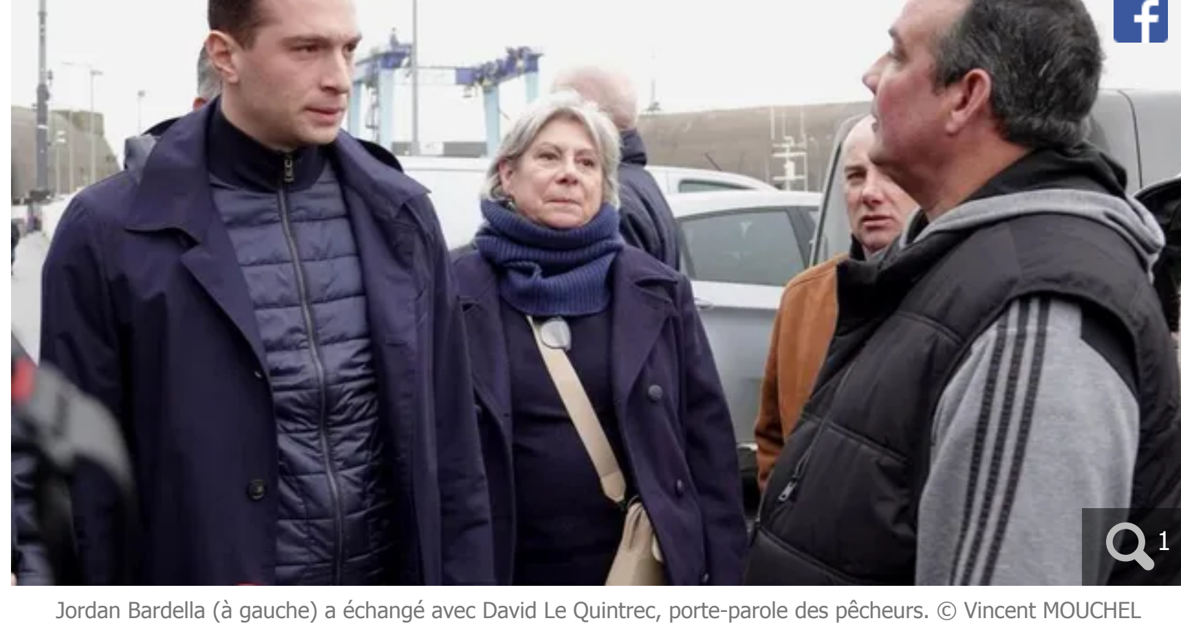
Jordan Bardella (à gauche) a échangé avec David Le Quintrec, porte-parole des pêcheurs.

Le leader du Rassemblement national est venu à la rencontre des marins-pêcheurs, mardi 23 janvier 2024, à Lorient (Morbihan). L'occasion de parler notamment de l'interdiction pour certains bateaux de pêcher dans le golfe de Gascogne jusqu'au 20 février.