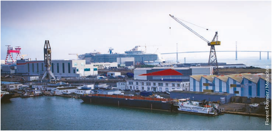
Setu Chanterioù an Atlantel e Sant-Nazer. Ouzhpenn 10.000 den a labour eno bep bloaz, 5 da 7.000 is-kevratourien anezho.

oa CMR (kankreiat -a gas ar c'hri- bev -, mutagenek pe pistrius evit ar gouennañ). Produioù zo evel-se hon eus bet implijet e-pad bloavezhioù a-raok ma vefent berzet. Ret eo cheñch penn d'ar vazh, evit hon bugale memestra. Re ziwezhat evidomp, lipet omp ! », emezi gant keuz.