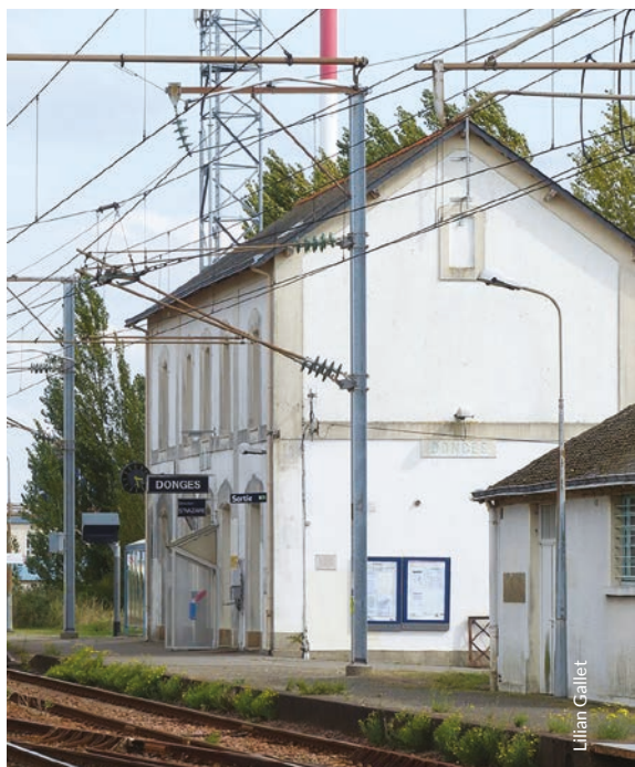
Setu ti-gar kozh Donez