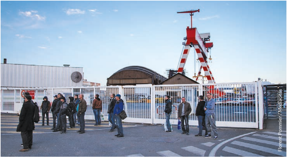
Micherourien dirak ar chanterioù o c'hortoz ar c'harr-boutin a zegaso anezho er ger.

venegiñ « kartennoù melen » da skouer, a oa bet staliet un nebeut bloavezhioù zo evit kastizañ ar re ha « ne labouront ket gant doareoù ar surentez ». « Ne gredan ket e vefe ar Chanterioù o lakaat buhez e vicherourien en arvar a-ratozh-kaer » a ouzhpenn dileuriad ar sindikad. Prest eo da anzav koulskoude : « Anat eo e ranner kavout doareoù nevez da gas ar c'heloù pelloc'h. Gant skouer an amiant eo bet lakaet sklaer e c'helle traoù zo bezañ ur riskl bras waran hir dermen. »