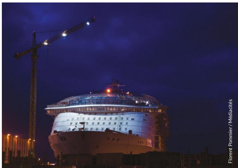
Setu ar vag dudi Symphony of the Seas.

« Aveet-mat omp amañ, eme Elliott, ur souder yaouank. Gwiskañ a reomp kougoulioù gwentet, ha kavout a reer reizhadoù sunañ ar moked war pep post labour. » Met klask ur gwarez direbech bepred zo 'vel klask pemp troad d'ar maout, emezañ : « gant ar renerezh ez omp broudet bremañ da implijout tumennoù sunañ moked a zo binviji pounner-mat ha diaes a-walc'h da embregañ. Krog omp da vont da fall ha da c'houzañv diwar stirenadoù ». N'eo ket gwall aes en em wareziñ diouzh gaz ha poultrenn pistrius ivez. « Dont a ra ar c'hudennoù dreist-holl pa vezomp o vont d'ul lec'h d'egile, pa dennomp hor c'hougoulioù.... Ret e vefe deomp gwiskañ bepred maskloù "fri-minoc'h" (FFP2). Met diaes eo pa vez tomm ha pa vez ganit da lunedoù-gwareziñ rak