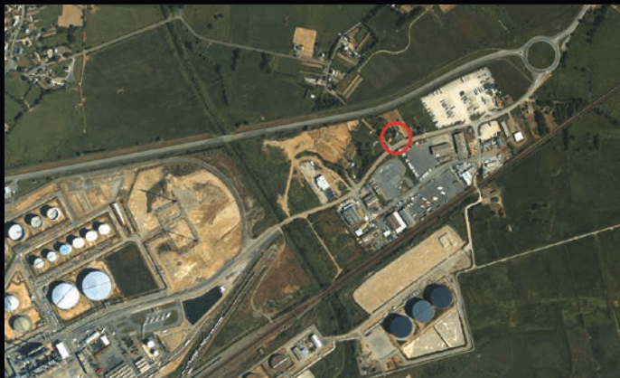
◀ 2004 Beuzet er burerezh eo kêriadenn Les Maraudais.