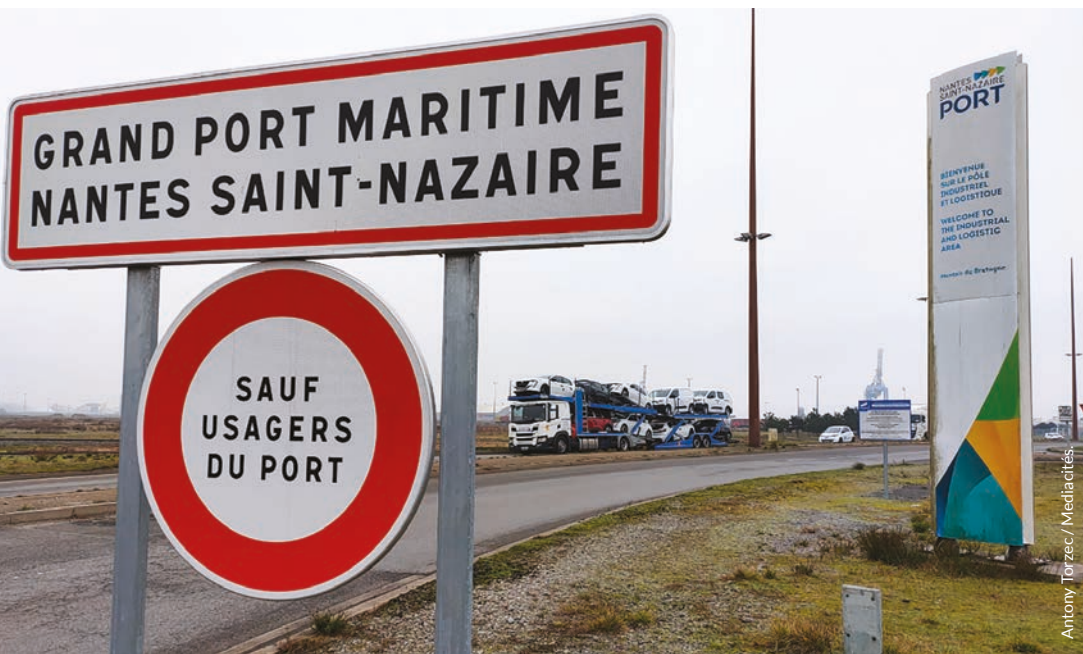
Setu mont e-barzh Porzh Bras Naoned-Sant-Nazer, e Moustier-al-Loc'h.

« Un deiz, goude al labour, e oan tapet fall :