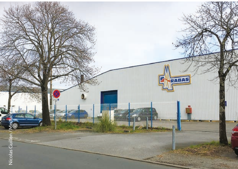
An embregerezh Rabas Protect a zo staliet e karter Mean-Penhoet, e Sant-Nazer.

diwar ar sevel eoul troioù-heol, hag e-tailh da zegas kleñvedoù an alaniñ 5 . Met ivez aezhennoù ar saver ludu kimiek Yara (un 9 c'hilometrad pelloc'h a-denn askell), hag ar c'hediadoù organek aezhidik (composés organiques volatiles – COV) diwar burerezh TotalEnergies (12 km alese) 6 .