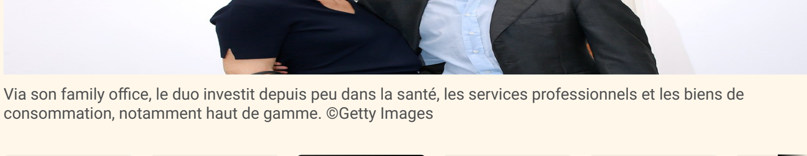
Via son family office, le duo investit depuis peu dans la santé, les services professionnels et les biens de consommation, notamment haut de gamme.